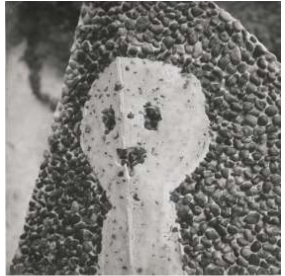
Détail de la surface après sablage

Kahnweiler écrivit à Brassai : « Vous devriez voir ce Norvégien à l'œuvre avec son arme bizarre, portant un casque qui lui donne l'air d'un martien ! » On voit sur le détail l'effet produit par cette technique. Les galets, d'un gris bleuté, proviennent de Cayeux-sur-mer. Le sablage fut achevé le 21 octobre 1962.