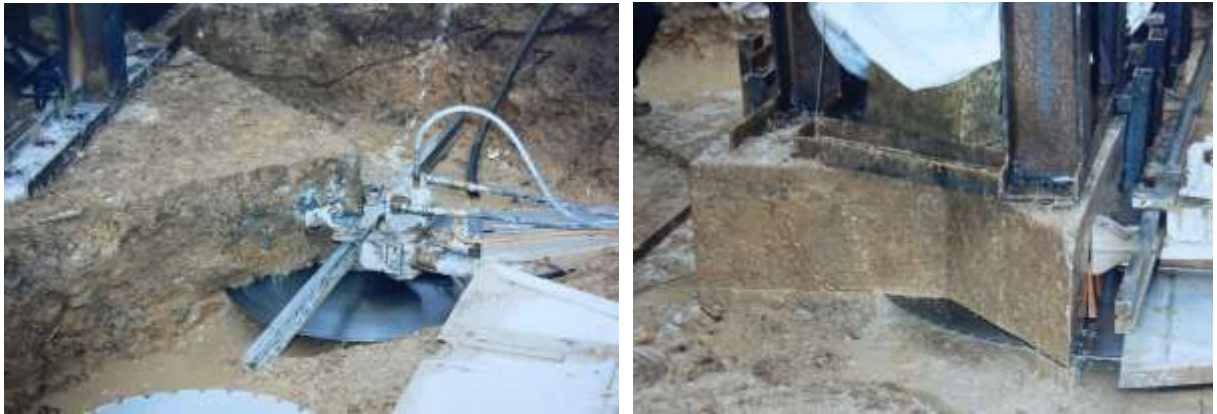
Sciage du socle en béton

La statue devait rester solidaire de son socle en béton qu'il a donc fallu découper à la scie.