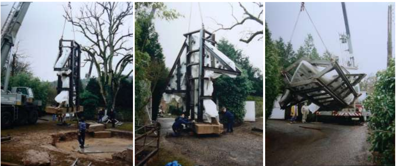
4 février 1995, l'heure du départ : à l'aide d'une énorme grue, la statue est positionnée sur la semi-remorque.