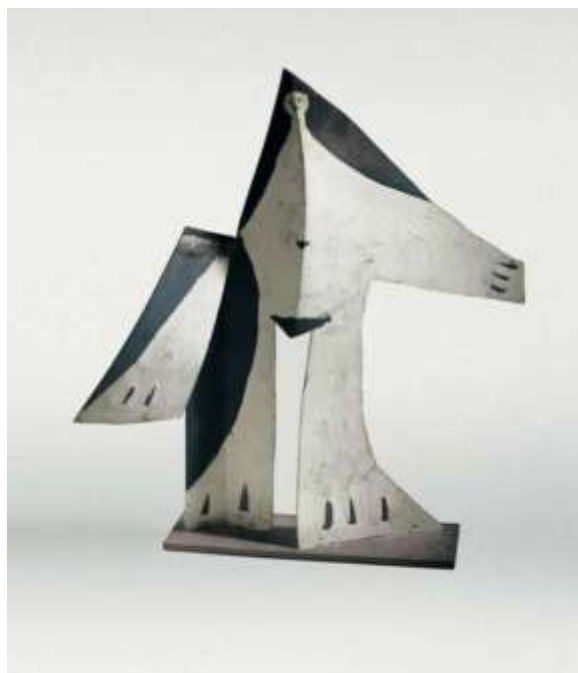
Une copie appartenant à la fondation Beyeler

Prévue pour une hauteur de 6m, une largeur de 5m, avec une épaisseur de seulement 10 cm, la construction projetée était, à l'époque, la plus grande statue en béton conçue par Picasso. Sa réalisation était donc particulièrement délicate et il a fallu le concours de plusieurs spécialistes pour la mener à bien.