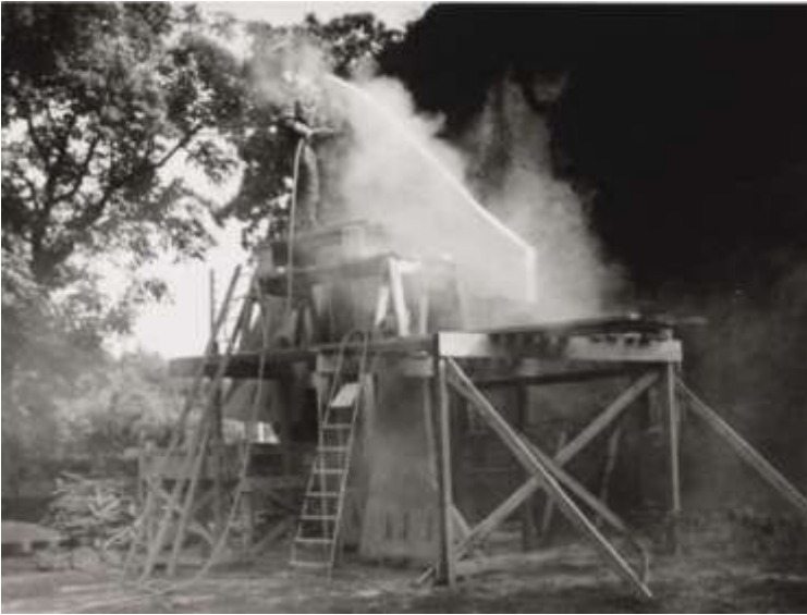
Opération de sablage par Carl Nesjar

coulage, le séchage et le décoffrage, le sablage fut un travail long et pénible. Son but était de faire réapparaître, sur les parties noires, les galets qui avaient été incorporés au béton.