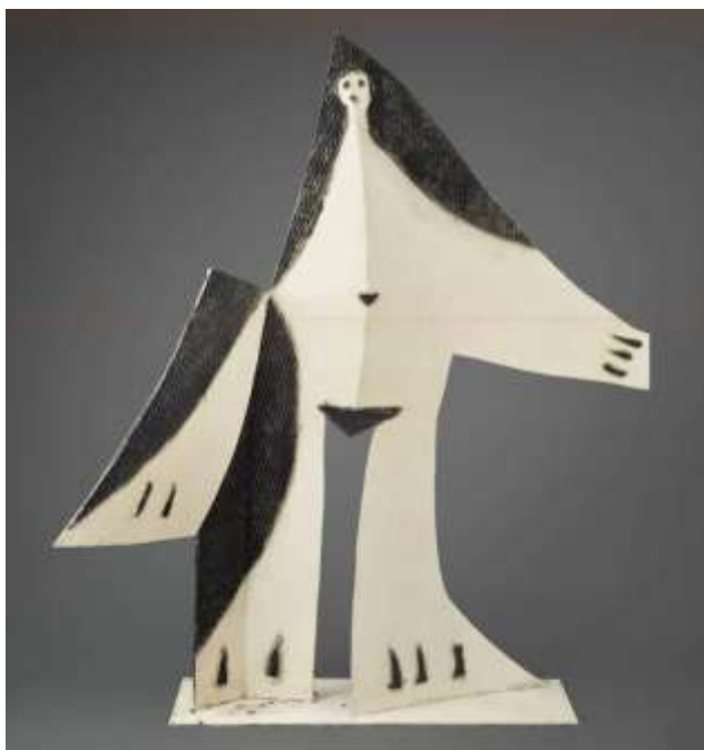
La première maquette en tôle découpée et grillage peint (musée national Picasso)