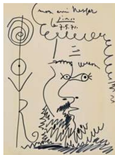
Carl Nesjar par Picasso (1971)

Nesjar et Kahnweiler décidèrent de placer l'ouvrage dans la première cour intérieure, au nord de la chapelle qui, avec ses murs recouverts de lierre, lui serviraient de toile de fond.