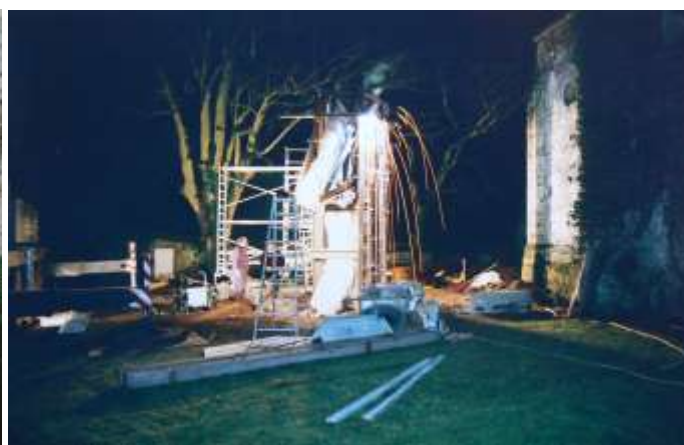
Le soudage de l'armature (on travaille même de nuit)