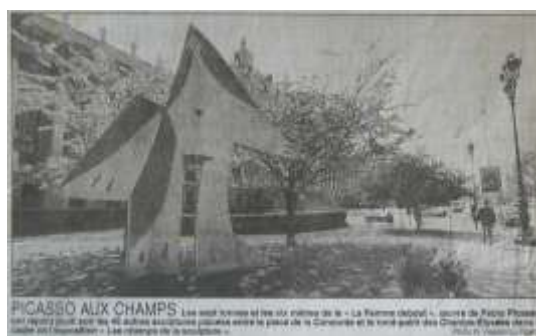
Le Figaro 23 mars 1996

Elle fut présentée ensuite d'avril à juin 1996 sur les Champs Élysées dans le cadre de l'exposition « Les champs de la sculpture »