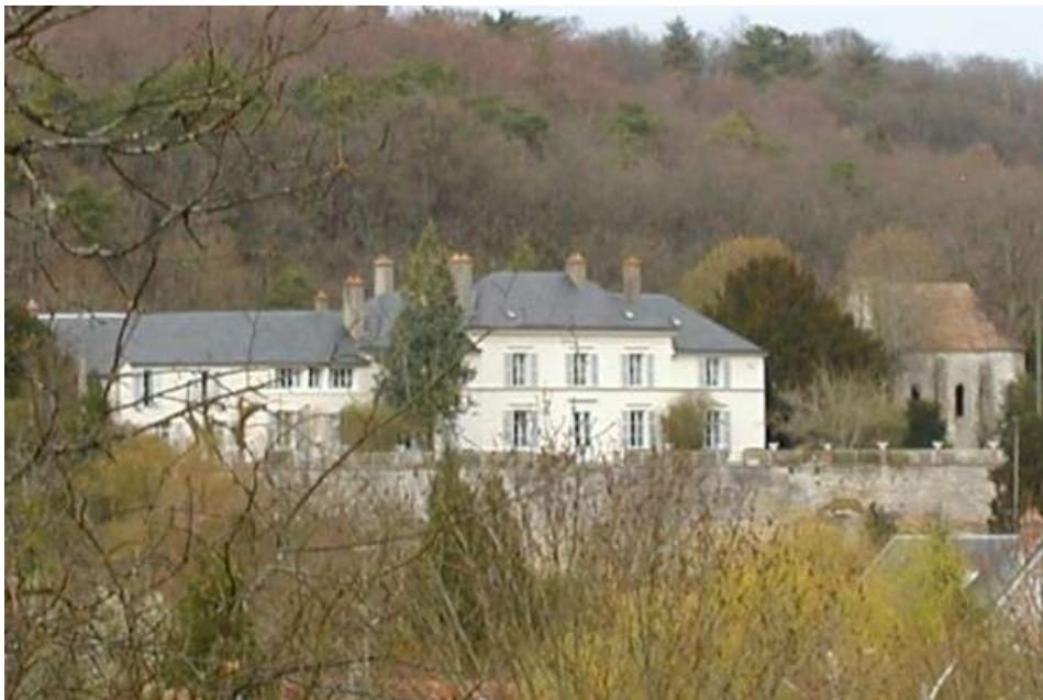
Les bâtiments du Prieuré, avec à droite, les ruines de la chapelle

Le village de Saint-Hilaire a abrité durant plus d'une trentaine d'années (de 1962 à 1996) une œuvre monumentale de Picasso, la « Femme aux bras écartés », aussi appelée primitivement « La femme debout ». En dépit de ses dimensions impressionnantes, la présence de cette statue, fut discrète car à l'abri des regards dans l'enceinte close de hauts murs d'une propriété privée, le Prieuré, belle demeure reconstruite au début du XIX e siècle, qu'on appelle localement « le château ».