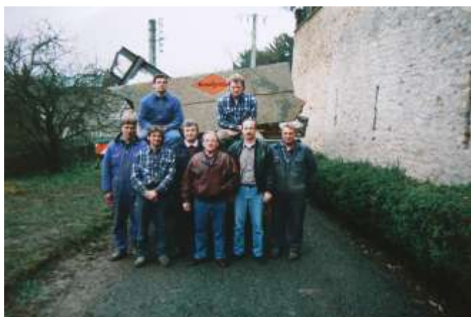
L'équipe d'ouvriers allemands

La première étape fut la construction d'une armature métallique très rigide, ancrée sur le socle en béton.