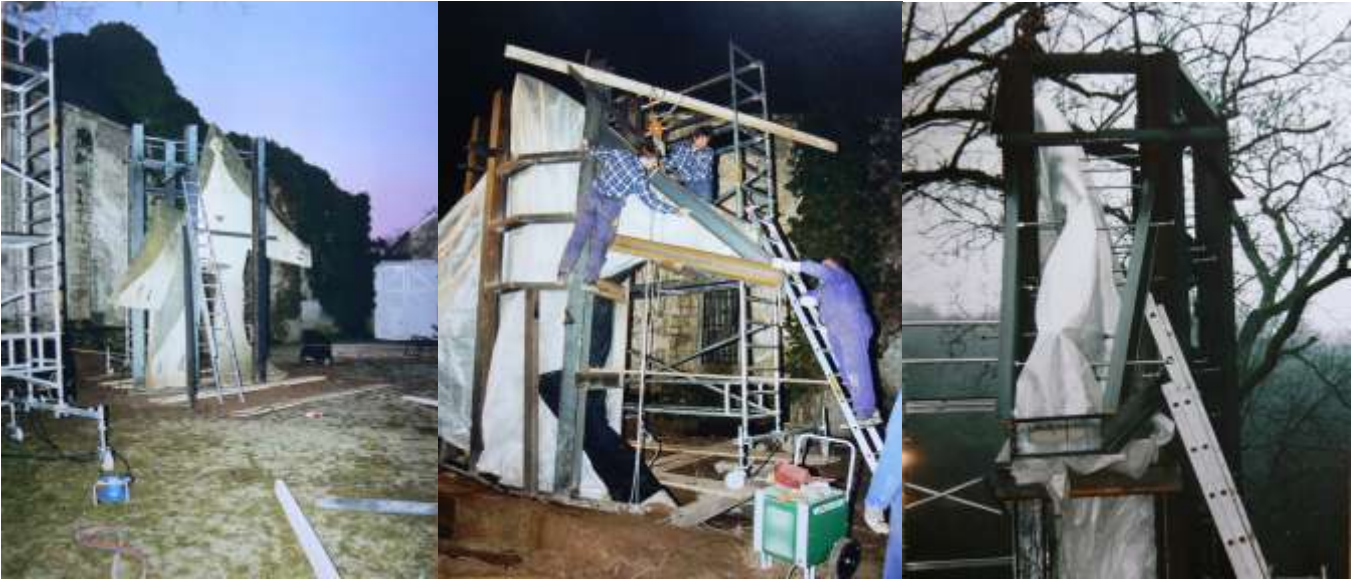
Différentes étapes de la construction de l'armature

La statue devait rester solidaire de son socle en béton qu'il a donc fallu découper à la scie.