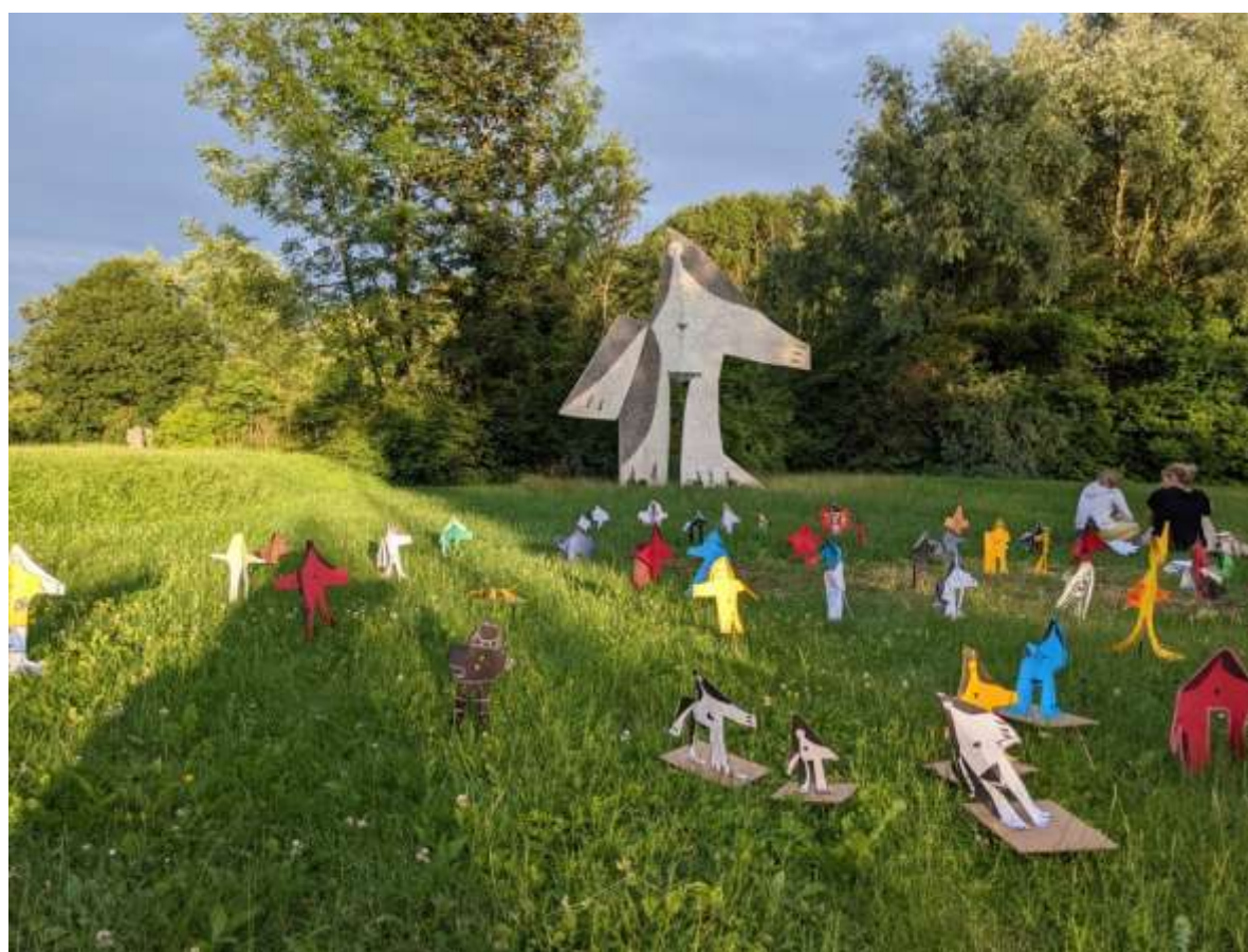
« Femme aux bras écartés » connaît depuis une nouvelle vie au LaM (Lille Métropole musée d'art moderne) à Villeneuve d'Ascq.