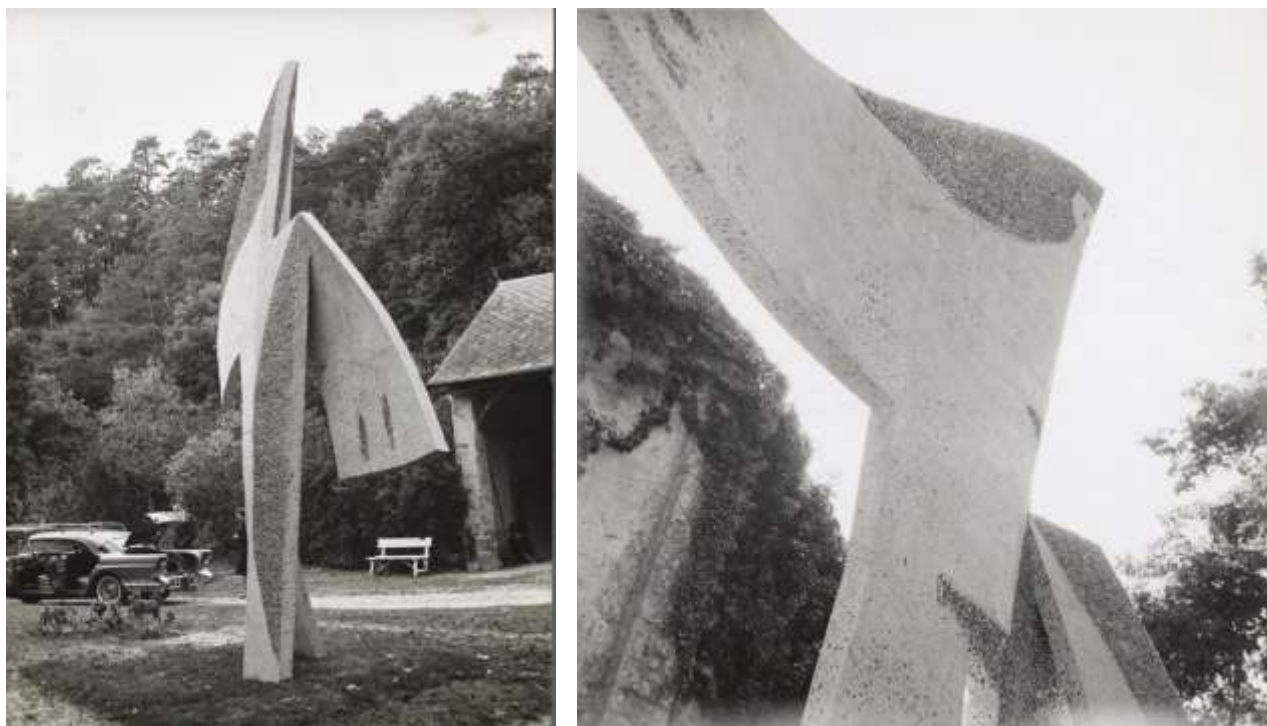
Deux angles de vue inhabituels de la statue