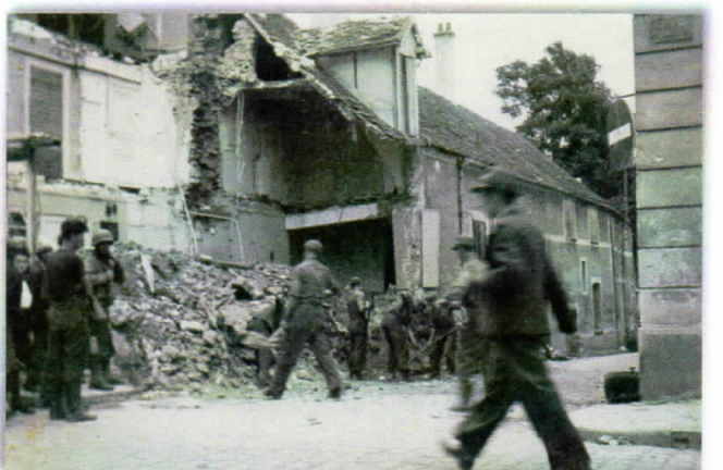
Rue de la Plâtrerie : déblaiement par des POW allemands [2 septembre].