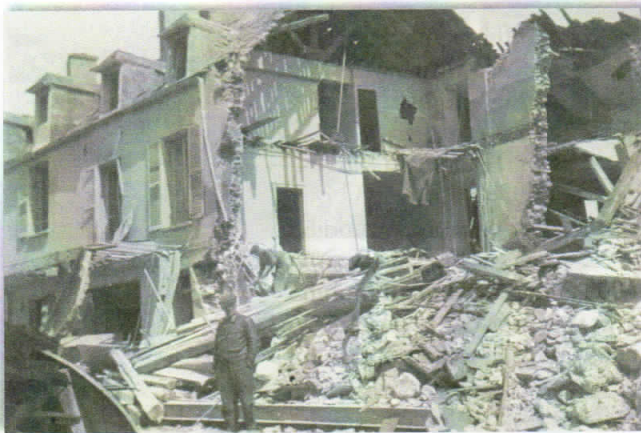
Hôtel du Grand Courier.