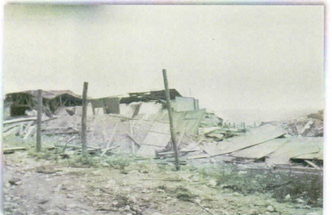
7 - Baraquements de l'école des sous-officiers allemands.