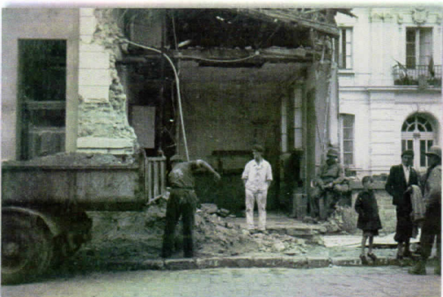
Salle des fêtes : déblaiement par des POW allemands [2 septembre].