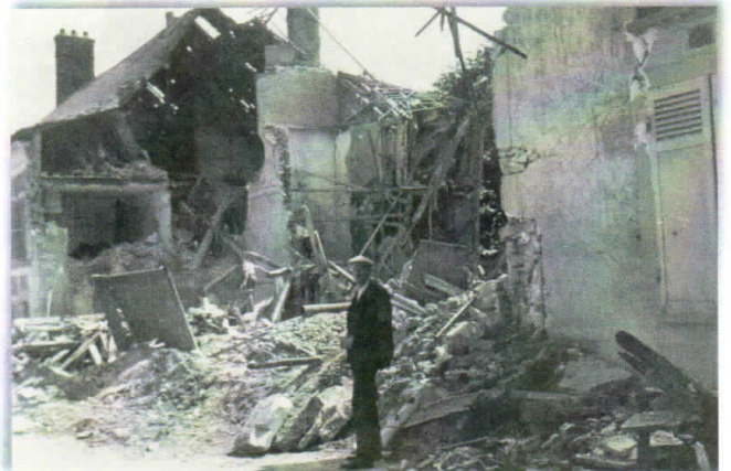
Rue de La Porte Dorée.