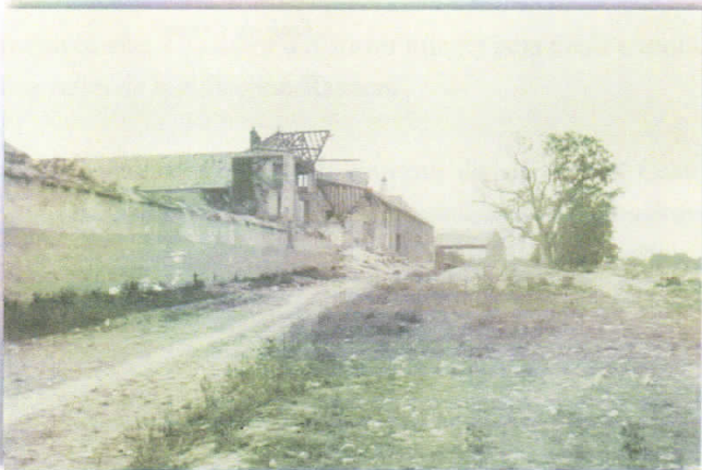
Ferme de Guinette.