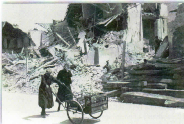
Rue des Cordeliers.