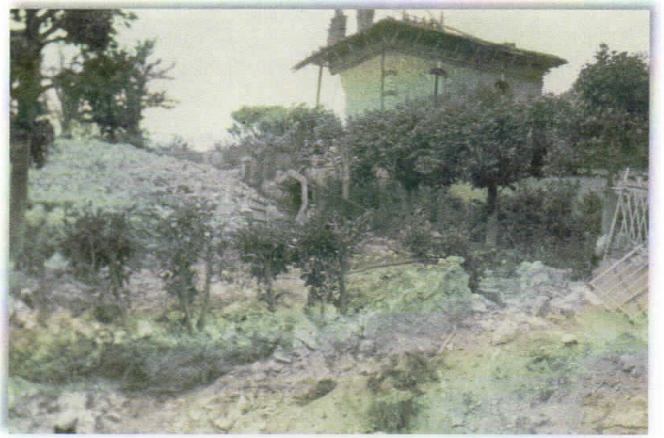
Villa La Tour promenade de Guinette.