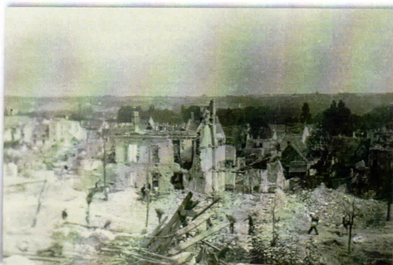
Vue générale de la promenade de Guinette au pont Saint-Gilles.